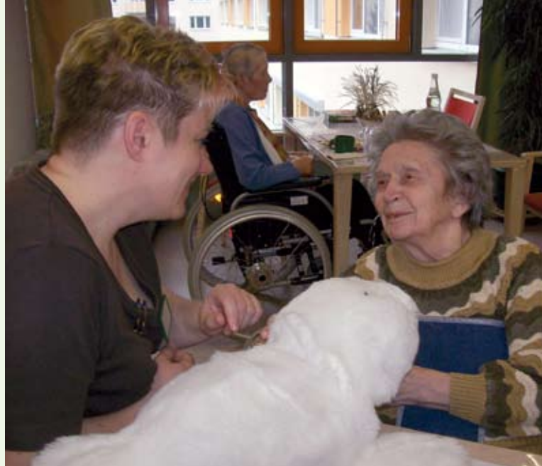
Große Kulleraugen – Robbe „Paro“ im Seniorenpflegeheim „Dr. Fritz Zeth“ in Suhl