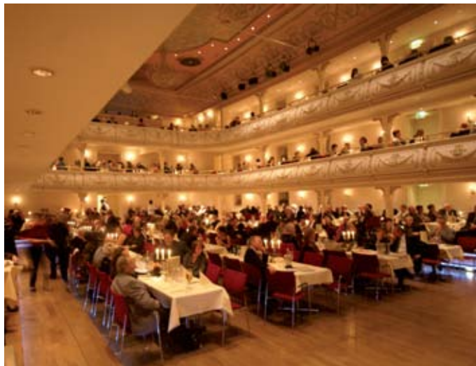
Der AWO-Ball 2010 im Erfurter Kaisersaal

Der diesjährige AWO-Ball findet am 28. Oktober im Erfurter Kaisersaal statt. Die Einladungen werden über die Geschäftsstellen der AWO-Kreisverbände vergeben. Im feierlichen Rahmen wird zum 13. Mal die höchste Auszeichnung für ehrenamtliches Engagement, die Emma-Sachse-Ehrung, verliehen. Anlässlich des Europäischen Jahres der Freiwilligentätigkeit hat der AWO Landesverband zudem einen Projektwettbewerb „Ausgezeichnete Ideen für eine gute Sache“ ausgelobt. Bewerben konnten sich AWO-Projekte, die ehrenamtlich initiiert, organisiert und getragen werden und die soziale Landschaft in Thüringen durch ehrenamtliches Engagement bereichern. Die drei besten Projekte werden zum diesjährigen AWO-Ball vorgestellt und mit einem Preisgeld in Höhe von insgesamt 1.500 Euro ausgezeichnet.