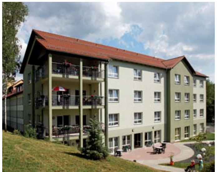
Seniorenpflegezentrum „Am Lerchenberg“ Zella-Mehlis: Note 1,0