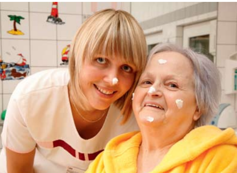
Seniorenpflegeheim „Am Birkenwäldchen“ Zeulenroda: Note 1,2