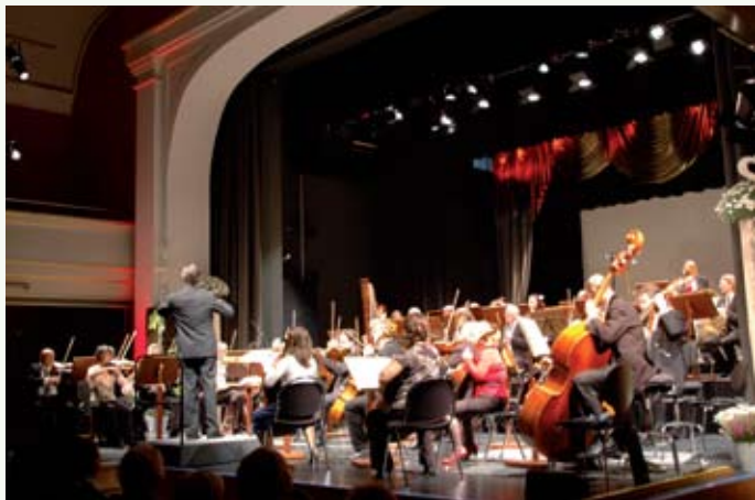
Die Symphoniker holten den Frühling in den Saal des „Meininger Hofes“

Alle Mitarbeiter, Mitglieder und Ehrenamtlichen des AWO Kreisverbandes Saalfeld-Rudolstadt e. V. waren geladen. Fast 500 kommen, denen aufgespielt wird. Mit leichter Hand war ein musikalisches Menü komponiert, das vielen mundete. Obwohl die Auswahl mutiger war als zur Premiere 2010. Damals dominierten Operettenmelodien und Filmmusiken. Dieses Mal setzte schon das Entree mit der Ouvertüre aus Rossinis „Barbier von Sevilla“ ein anspruchsvolles Zeichen.