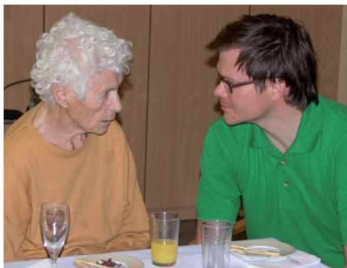
Carsten Schneider im „Haus zu den vier Jahreszeiten“ Erfurt